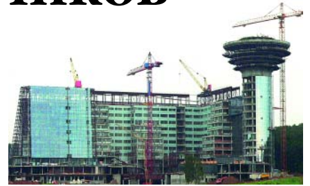
Административно-общественный центр Московской области

ОАО «Трест Мосэлектротягстрой» — генподрядный строитель-монтажный трест по строительству, капитальному ремонту, реконструкции и перевооружению объектов полного перечня категорий сложности и назначений. За более чем полувековую историю строительной деятельности трест зарекомендовал себя конкурентоспособным на строительном рынке и готовым реализовать любые требования заказчиков.