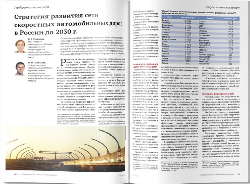
Таблица 1. Плотность автомобильных дорог в разных странах и федеральных округах РФ