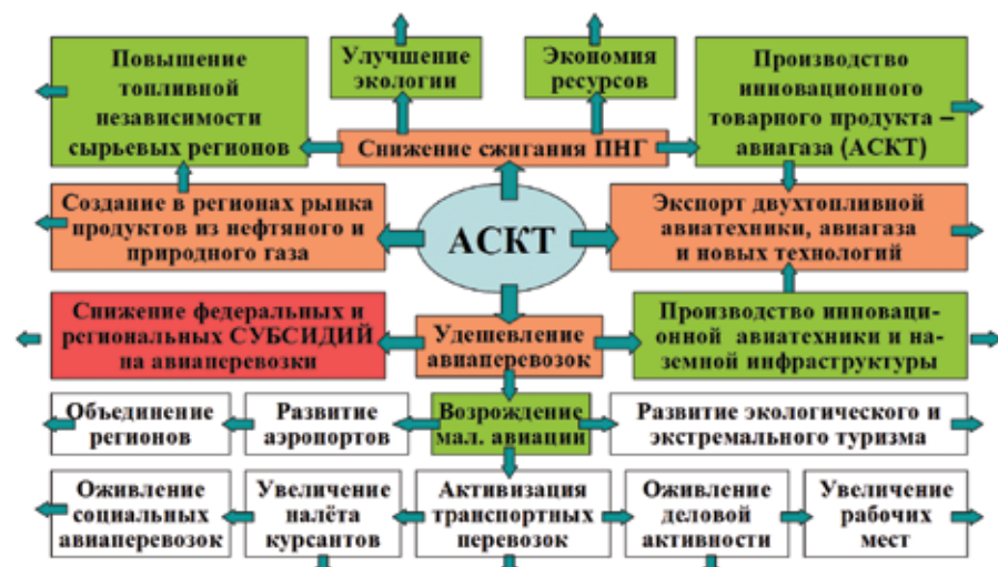
Рис. 7. Мультипликативный эффект от внедрения АСКТ

субсидиями, составляющими несколько миллиардов рублей в год.