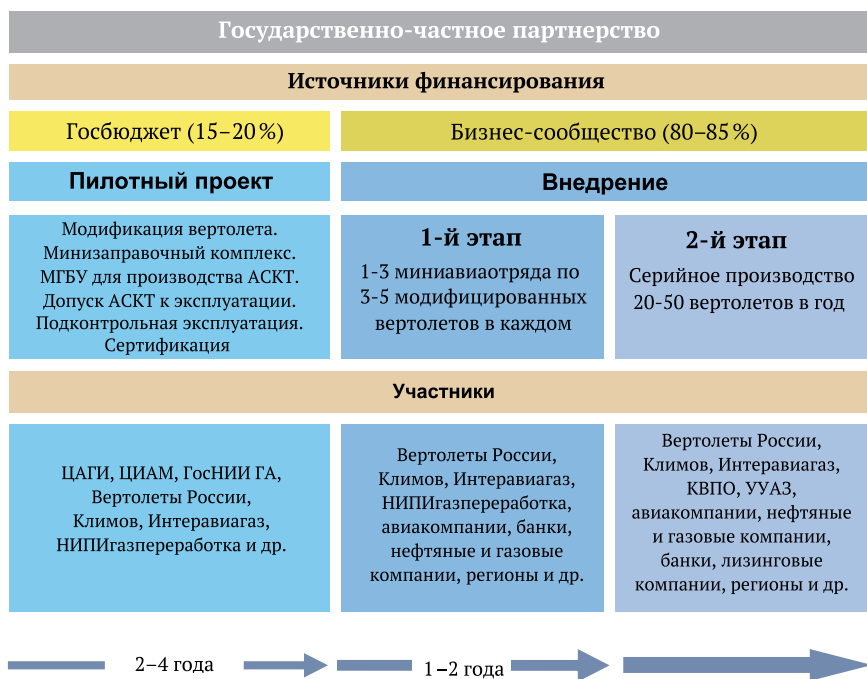
Рис. 6. Схема распределения затрат при осуществлении проекта на базе ГЧП