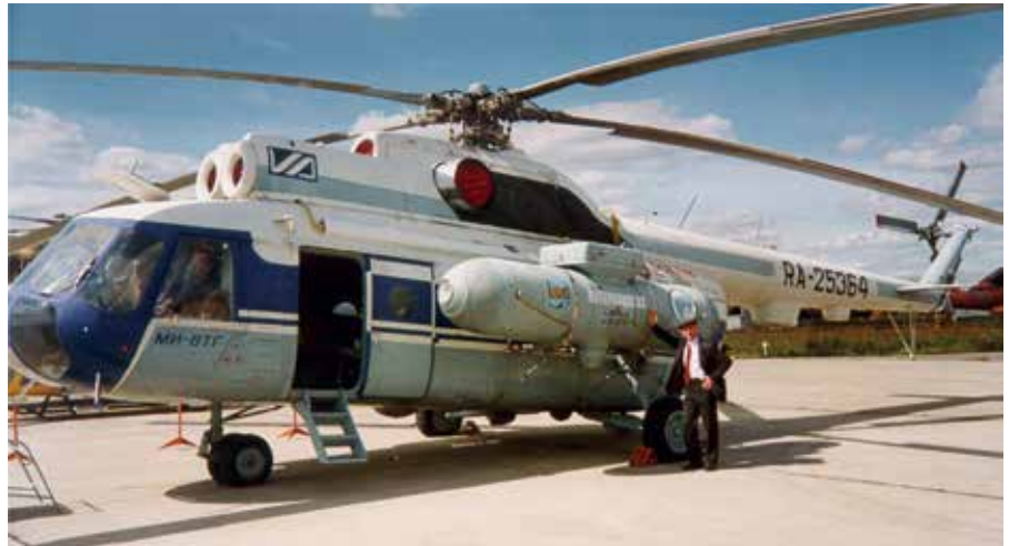
Рис. 4. Газолёт – вертолёт на газовом топливе (МАКС-95)