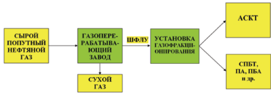
Рис. 3. Схема разгонки попутного нефтяного газа

Реальность использования АСКТ была доказана в ходе наземных и лётных испытаний экспериментального вертолёт Ми-8ТГ. Первый в мире опытно-промышленный образец вертолёт Ми-8ТГ, оба двигателя которого могут работать как на АСКТ, так и на обычном авиакеросине, а также на их смесях практически в любой пропорции, был создан в начале 1990-х годов на ОАО «Московский вертолётный завод им. М. Л. Миля» при активном участии ОАО «Интеравиагаз». Этот вертолёт показал отличные результаты на всех режимах, характерных для Ми-8Т. Двухтопливный вертолёт-газолёт демонстрировался в полете на авиасалоне «МАКС-95» (рис. 4). Расчеты и испытания показали, что при переходе на газовое топливо характеристики вертолёт остаются практически неизмен-