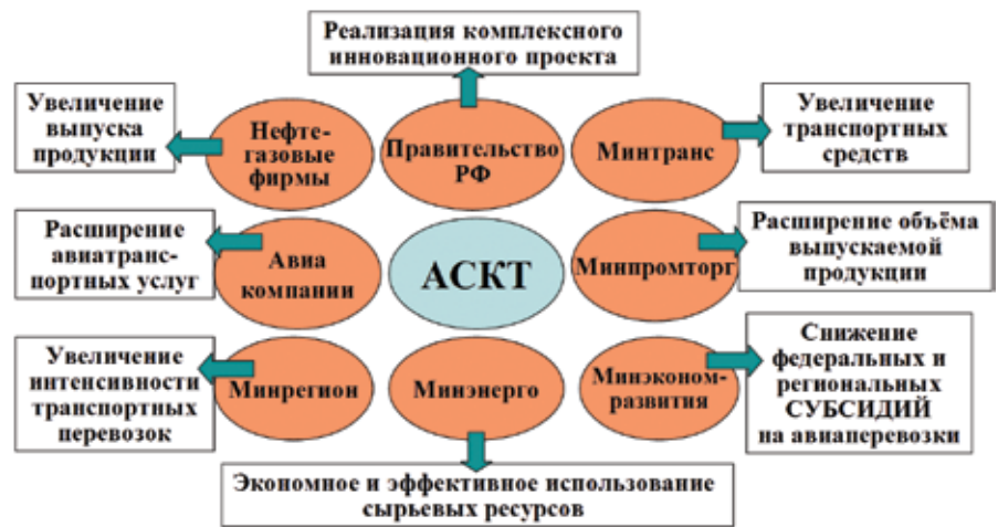
Рис. 5. Эффект от внедрения АСКТ для различных отраслей

ными, а некоторые даже улучшаются (в том числе при эксплуатации в условиях пониженных температур). Позже Ми-8ТГ получил более 20 наград и номинаций на различных выставках. Доказано, что использование АСКТ возможно и на самолётах – как существующих (Як-42, Ил-114, возможно, Ан-2), так и перспективных (Ту-136) с газотурбинными и с поршневыми двигателями.