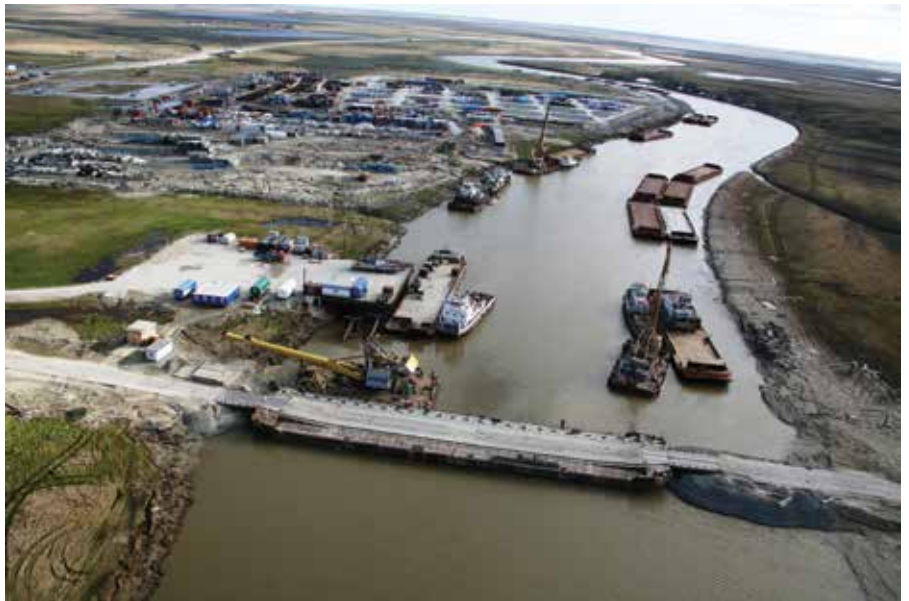
Переправа. Бованенковское месторождение

Только на полуостров Ямал флотом пароходства было завезено более 2 млн т грузов, предназначенных для ос-