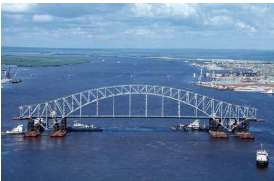
Установка моста в Ханты-Мансийске

ОАО «Обь-Иртышское речное пароходство» 109156, Москва, Жулебинский бульвар, 25 Тел.: +7 (498) 505-02-40 Факс: (498) 505-02-39 mrf-40@mail.ru