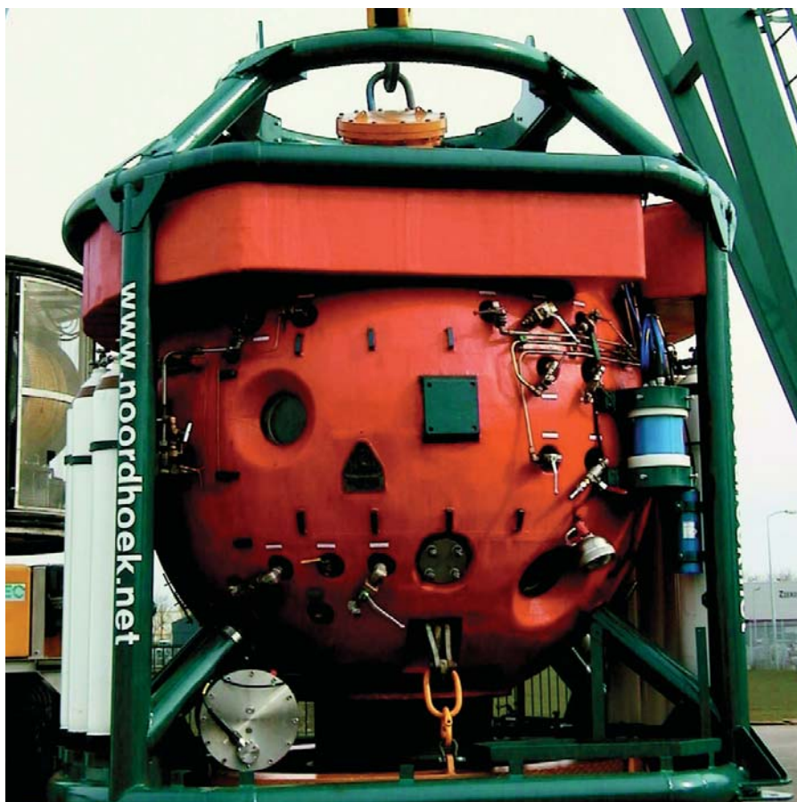
Рис. 4. Водолазный колокол в составе TUP Diving System

Основные преимущества системы TUP по сравнению со спусками в водолазной беседке или «мокрым» колоколе таковы: