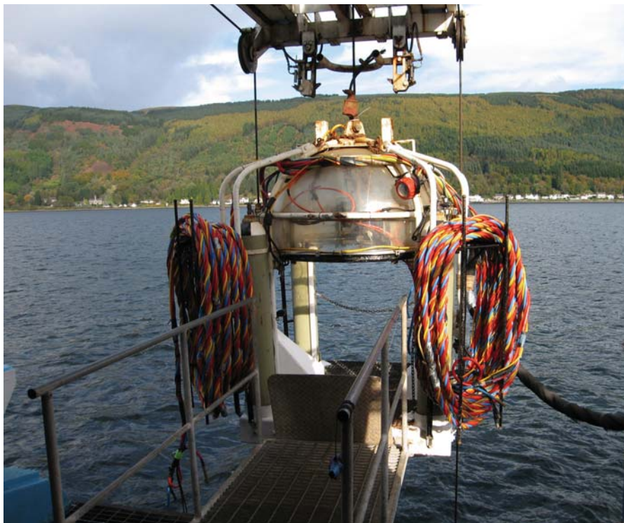
Рис. 6. Мокрый водолазный колокол

Создать некий универсальный водолазный комплекс снаряжения и оборудования, пригодный на все случаи жизни, практически невозможно. Многообразие, которым отличаются условия водолазных спусков и характер выпол-