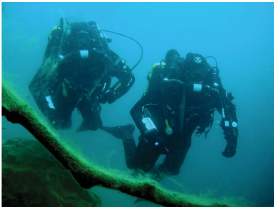
Рис. 7. Спуски в автономном режиме