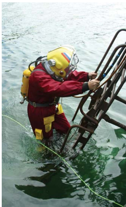
Рис. 1. Погружение в вентилируемом снаряжении

Насыщенные погружения — это водолазные спуски методом длительного пребывания человека под повышенным давлением газовой среды. Они осуществляются из условий повышенного давления газовой среды барокамер водолазного комплекса. Время пребывания под повышенным давлением газовой среды равно времени полного насыщения тканей организма индифферентными газами или превышает его. Последующая декомпрессия происходит в этих же барокамерах.