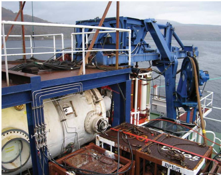
Рис. 2. Глубоководный водолазный комплекс