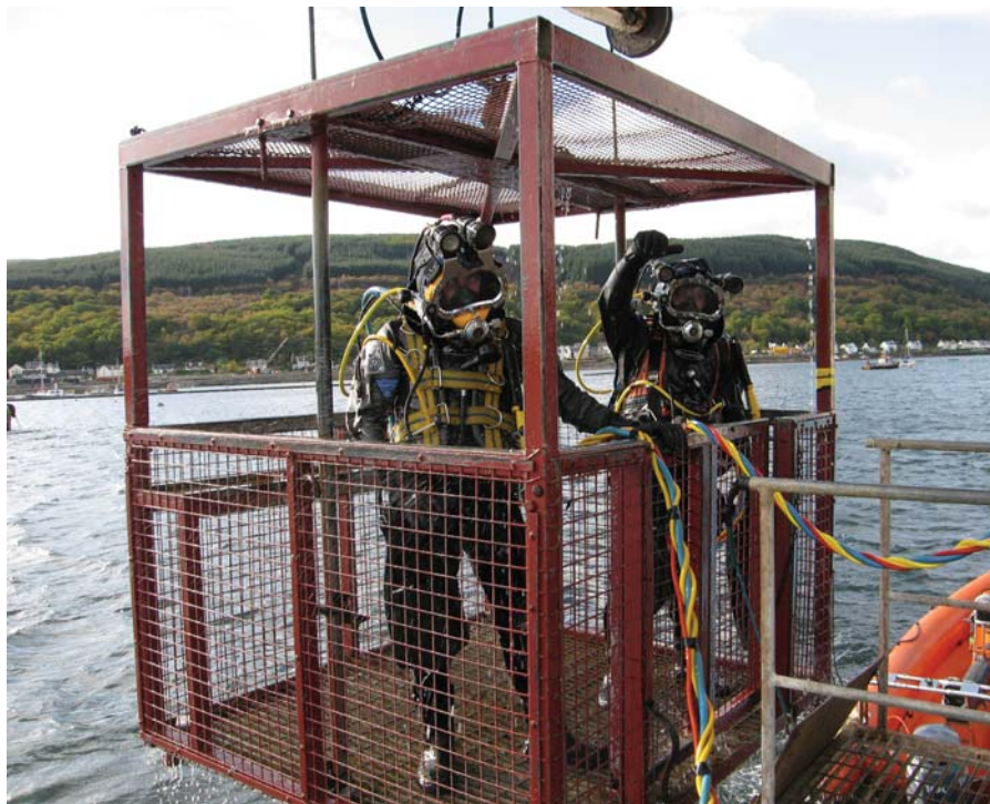
Рис. 3. Водолазная беседка

Методика TUP наиболее эффективна при выполнении широкомасштабных подводно-технических, судоподъемных и аварийных работ на глубинах 30–100 м, когда задачи и объем этих работ требуют непрерывной и интенсивной деятельности водолазов на локализованном объекте.