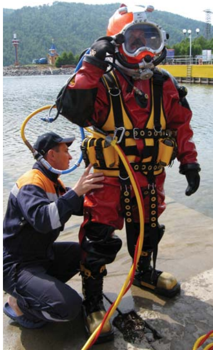
Рис. 5. Спуски в шланговом снаряжении с поверхности