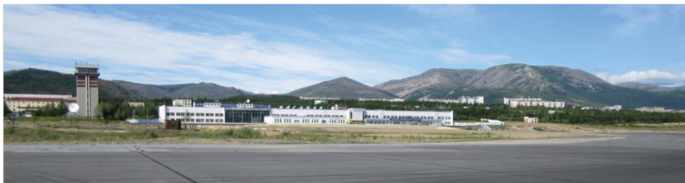
Аэропорт в Магадане

В течение года предприятие осуществляло функции заказчика-застрой-