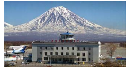
Аэропорт в Петропавловске-Камчатском

Работы по проектированию, строительству и реконструкции аэродромов осуществляются за счет средств государственных капитальных вложений в соответствии с утвержденной Министерством экономического развития «Федеральной адресной инвестиционной программой на 2011 год и на плановый период 2012 и 2013 годы». Кроме того, аэропорты привлекают инвестиции в рамках государственно-частного парт-